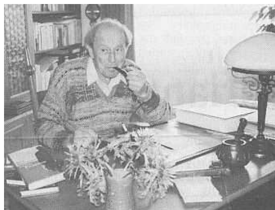
Repro Der Bayerwald-Bote, 19. 10. 1996, s. 46