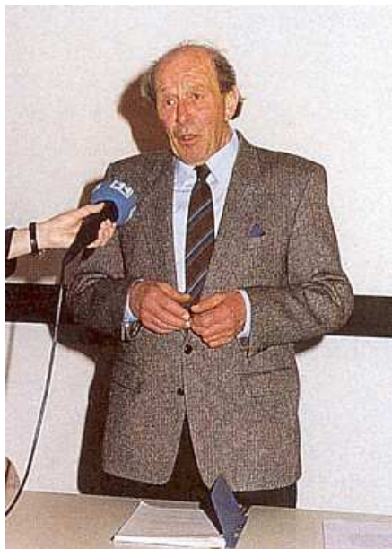
Na jedné z besed o díle Klostermannově